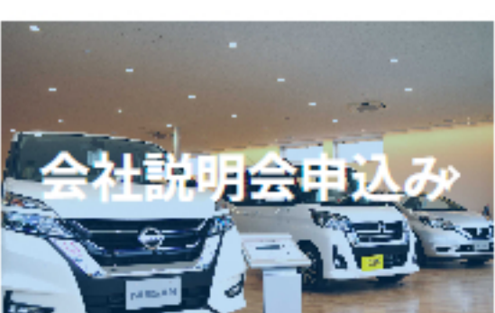
会社説明会申込み