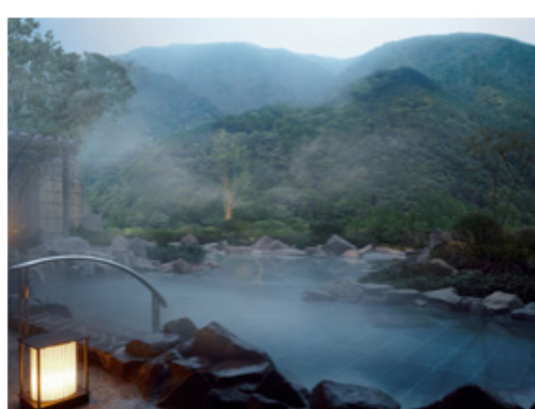
エクシプ箱根離宮

リゾートトラストの会員なので全国の会員制高級リゾートホテルに格安で宿泊できます。