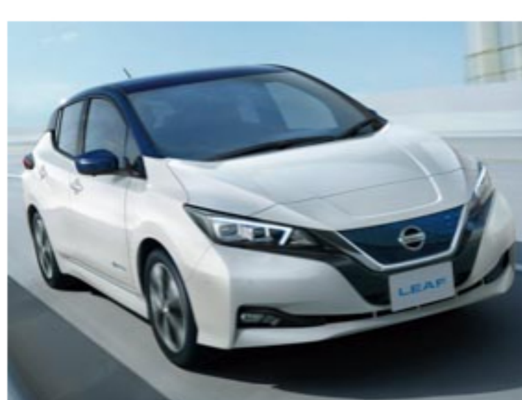
新車中古車購入時の割引

日産サテリオ埼玉の社員は社員割引購入制度が利用できます。なんとこの社員割引は2親等の家族まで利用が可能です。2親等とは、本人または配偶者から数えて2世代のこと、つまり社員または配偶者の両親や祖父母、兄弟が社員割引で車を購入できます。