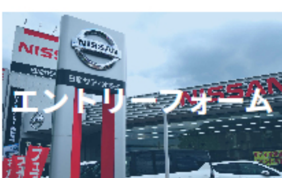
エントリーフォーム