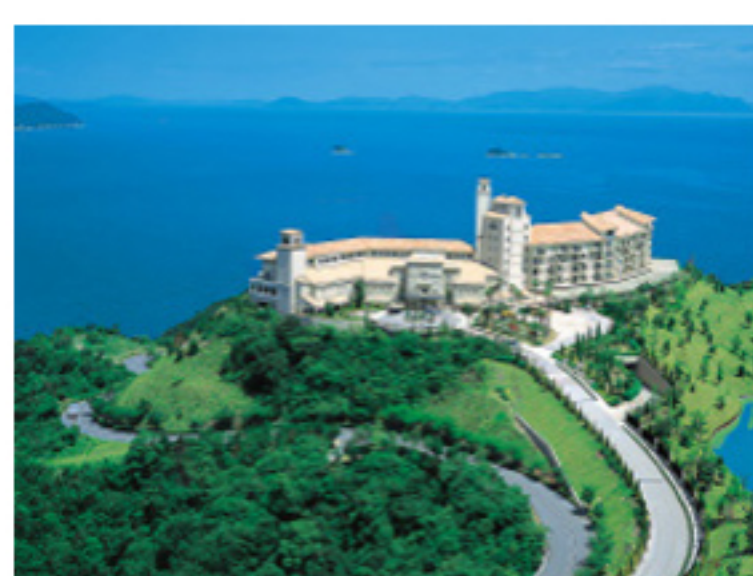
グランドエクシプ鳴門