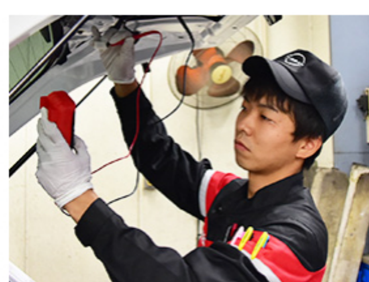
整備及び修理代の割引