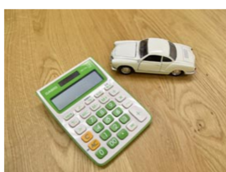
クレジット金利の優遇