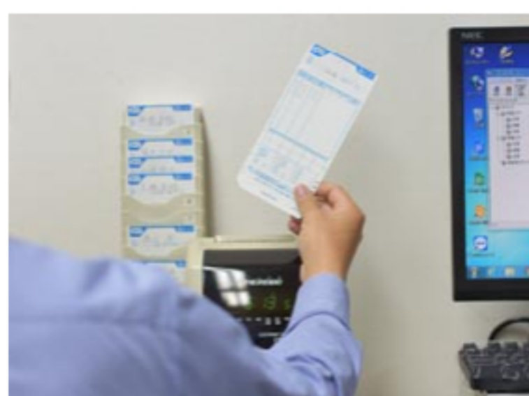
長時間労働の抑制