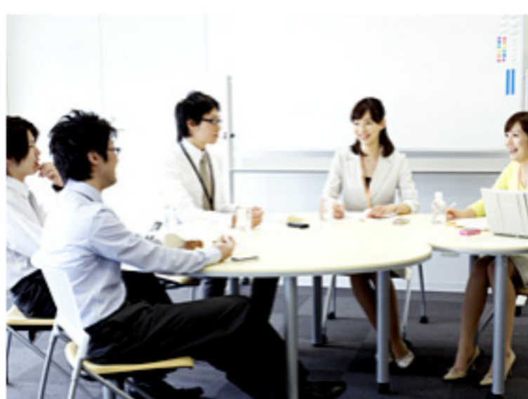
意見の言いやすい環境