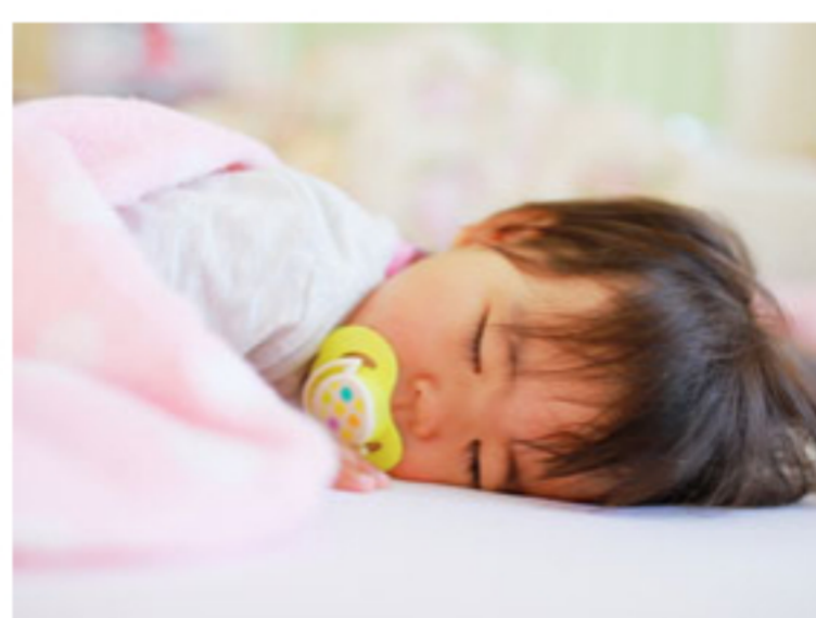
産休・育休の取得実績あり

”自動車業界は男社会”の時代は終わりました。今は女性が活躍できる会社でなければ生き残ることが出来ないと日産サティオ埼玉は考えています。日産サティオ埼玉では、男女関わらず同じチャレンジの機会を与えていますので、営業職でも活躍している先輩が多く働いています。