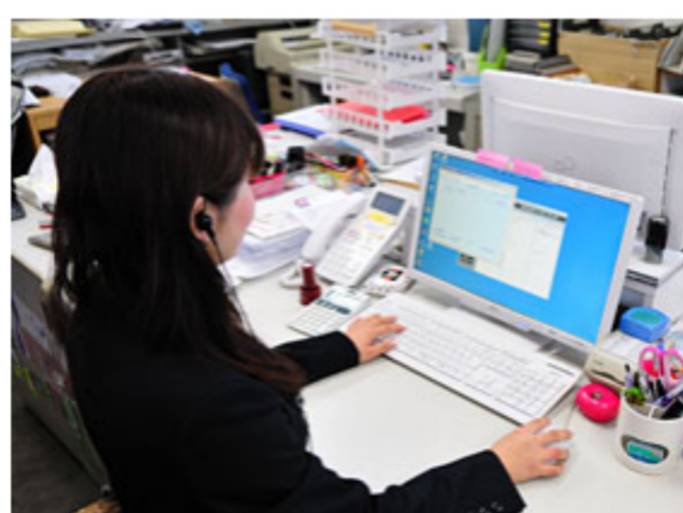
男女関係ないチャレンジ機会